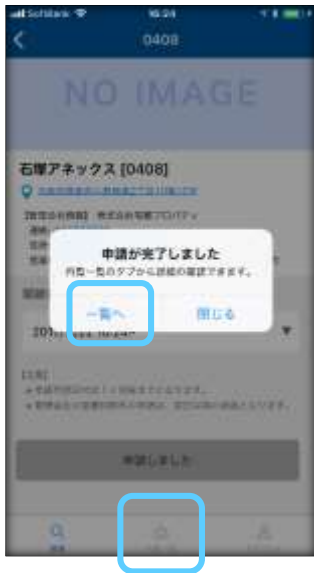
① 「一覧へ」もしくは「内覧一覧」を選択