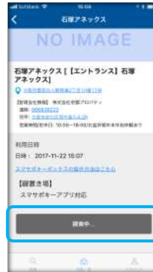
③現地オートロック前で A を選択すると【探索中】となります

B : 部屋開錠権限はSKBが扉に設置されている場合は【開錠権限】が付与、設置されていない場合は【鍵場所】が確認できます。