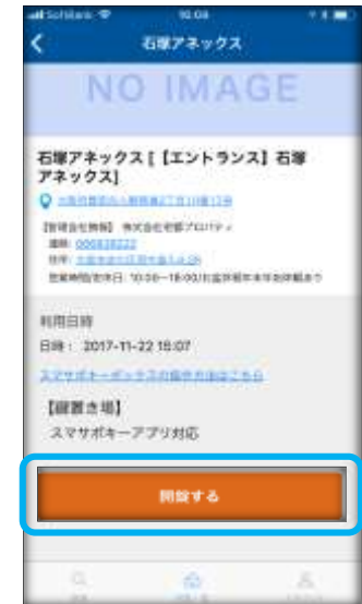
④Bluetoothが反応したら、タップ。オートロックが開錠されます。