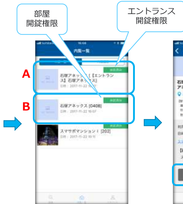
②スマサポキーボックス (SKB)

A : エントランスにSKBが設置されている物件は、部屋予約と同時にエントランス開錠権限が与えられます